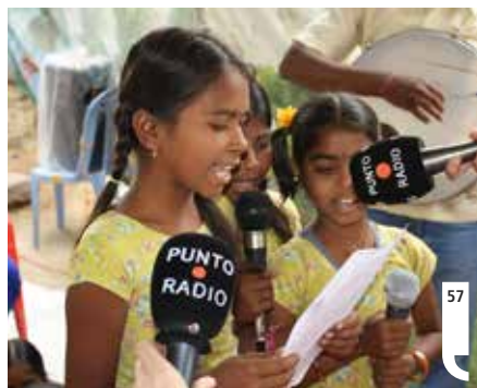
57 Izquierda. Equipo de enviados especiales de Punto Radio en Anantapur, en apoyo a la Fundación Vicente Ferrer.